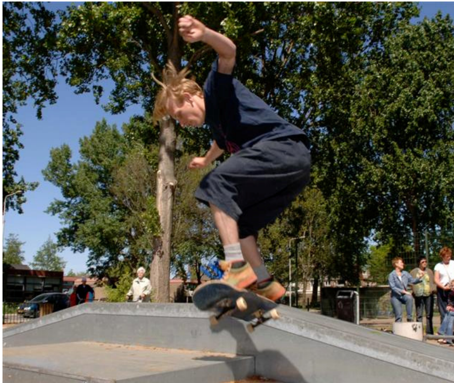
Skate-activiteiten, veiligheid is van belang

In het kader van activiteiten voor een bijdrage van de breedtesportimpuls zijn er vanaf 2004 diverse activiteiten uitgevoerd waarbij jeugd en verenigingsondersteuning centraal stonden. Te denken valt aan uitbreiding van buitenschoolse sport activiteiten, skatecursussen en sportactiviteiten door het jeugd en jongerenwerk.