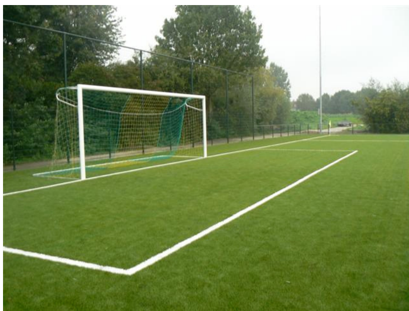
Kunstgras op Sportpark Adegeest

Het sportaccommodatieniveau van Voorschoten geeft een gemengd beeld. Aan de ene kant is er een aantal knelpunten tijdens de 'piekuren' en aan de andere kant is er genoeg ruimte voor bewegingsonderwijs. Van belang is een goede balans tussen aanbod en accommodatievraag. Door activiteiten te clusteren kunnen we doelmatig omspringen met accommodaties en meervoudig gebruik van accommodaties realiseren. Voor de gemeente blijft het uitgangspunt dat de kosten die gemoeid zijn met het beheer en exploitatie van de accommodaties beheersbaar moeten blijven.